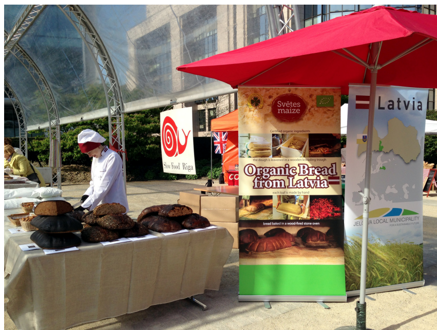
Biedri regulāri piedalās tirdziņos